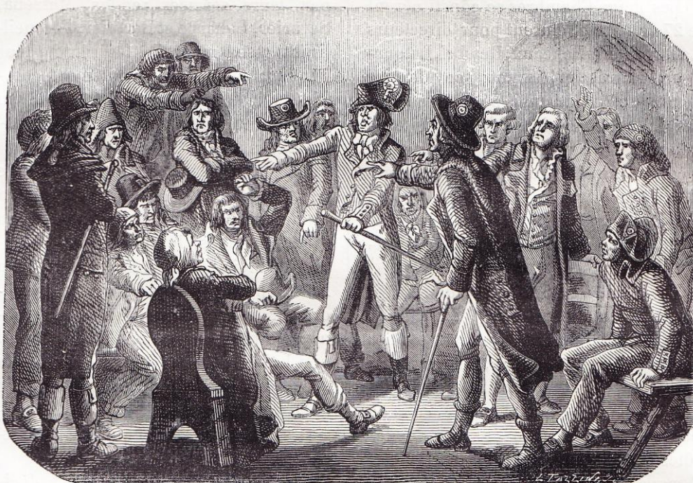
Séance du Comité d'insurrection de l'Évêché (mars 1793).

Ils soulevèrent les sections et ramassèrent dans la garde nationale 40 000