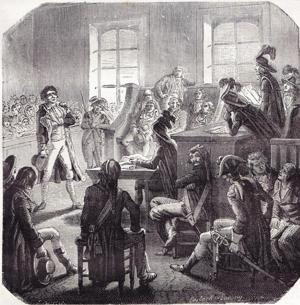
Marat devant le Tribunal révolutionnaire (24 avril 1793).

réorganiser le pays selon ses vues. Son ambition fut contrariée par les comités; Collot-d'Herbois, Billaud-Varennes s'unirent avec Tallien, Barras et Fouché, et engagèrent la lutte au