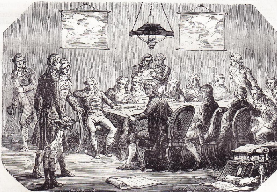
Premier Comité de salut public.

laret-Joyeuse livra cependant, le 1 er juin 1794, avec 25 vaisseaux montés par des paysans, un grand combat contre 38 voiles anglaises; il s'agissait de protéger l'arrivée d'un immense convoi de blé: le convoi passa et nous sauva de la famine, mais la flotte fut vaincue et perdit six vaisseaux; un d'eux, le Vengeur , fit une fin célèbre; plutôt que d'amener son pavillon, il se fit couler et tout l'équipage périt en chantant la